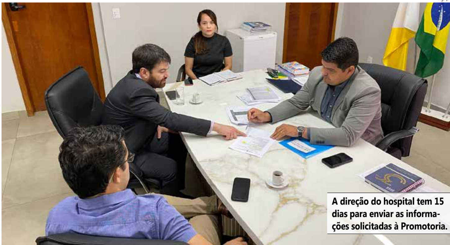
A direção do hospital tem 15 dias para enviar as informações solicitadas à Promotoria.