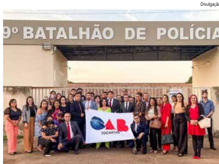
De 2019 até 2024 foram realizados 19 atos de desagravos.

Para se ter uma ideia da dimensão desse trabalho, somente entre os anos de 2022 e 2023, a Procuradoria de Prerrogativas reali-