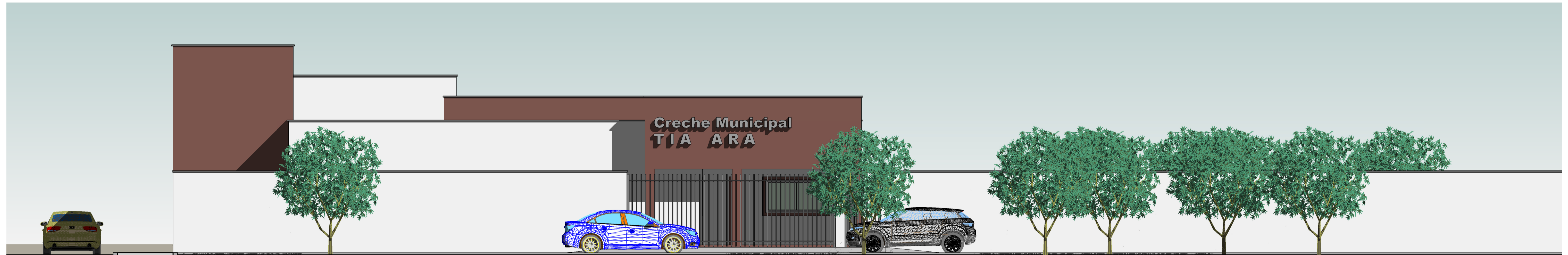
2 VISTA FRONTAL ESCALA 1:65