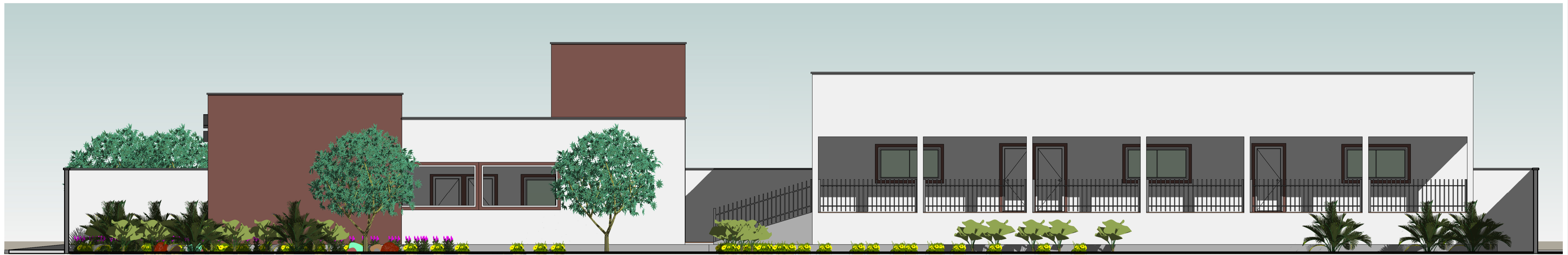
3 VISTA LATERAL DIREITA ESCALA 1:65