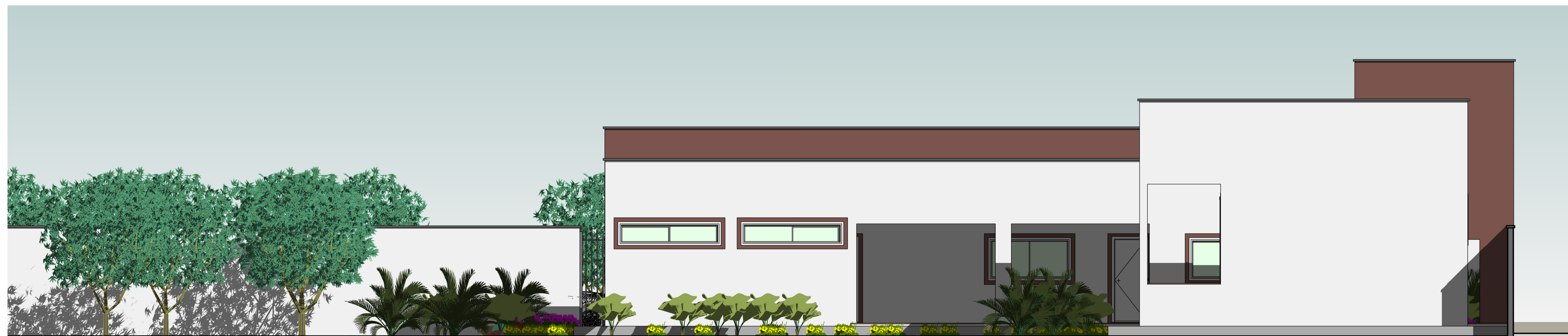
1 VISTA DOS FUNDOS ESCALA 1:65