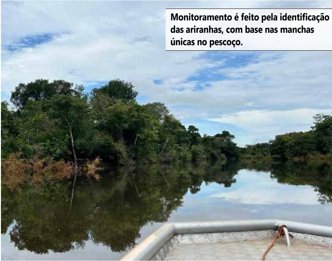
Fernando Alves/Governo do Tocantins

Com duração de 10 anos, o programa Pró-Ariranha é dividido em quatro campanhas anuais. Neste ano, a primeira campanha inicia agora em março, dando continuidade ao trabalho de monitoramento da espécie. O programa abran-