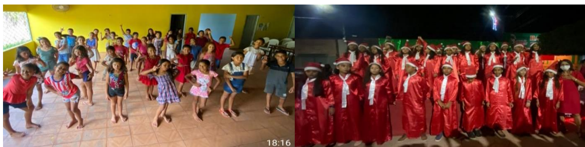
Ballet, Coral e atividades extracurriculares