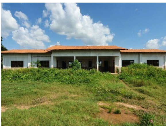
Escola Amiguinhos de Jesus: Antes