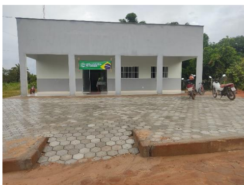
Escola PA Canaã

Em 2022 foi inaugurada a Escola Municipal Amiguinhos de Jesus no Distrito de Centro dos Ferreira e realizada reformas e melhorais na Escola Municipais Luiz Gonzaga de Sousa, principalmente no quesito acessibilidade. Outra obra de relevância foi a reconstrução de toda a Escola Municipal PA Canaã.