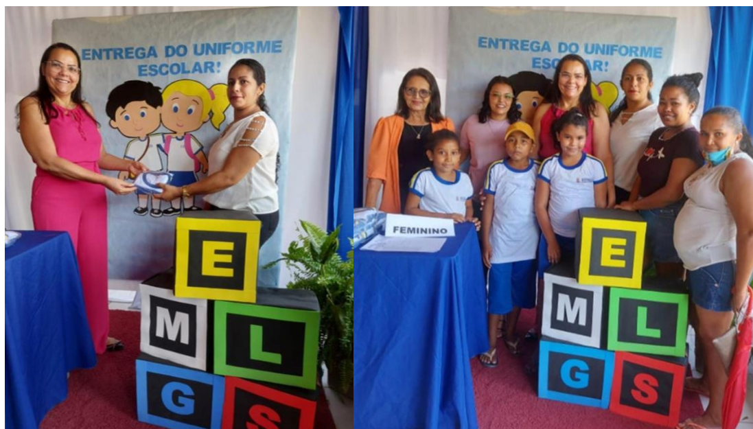
Entrega de Uniformes Escolares