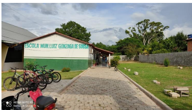
Escola Municipal Luiz Gonzaga de Souza