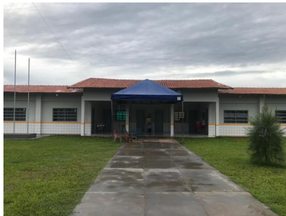
Escola Amiguinhos de Jesus: Depois