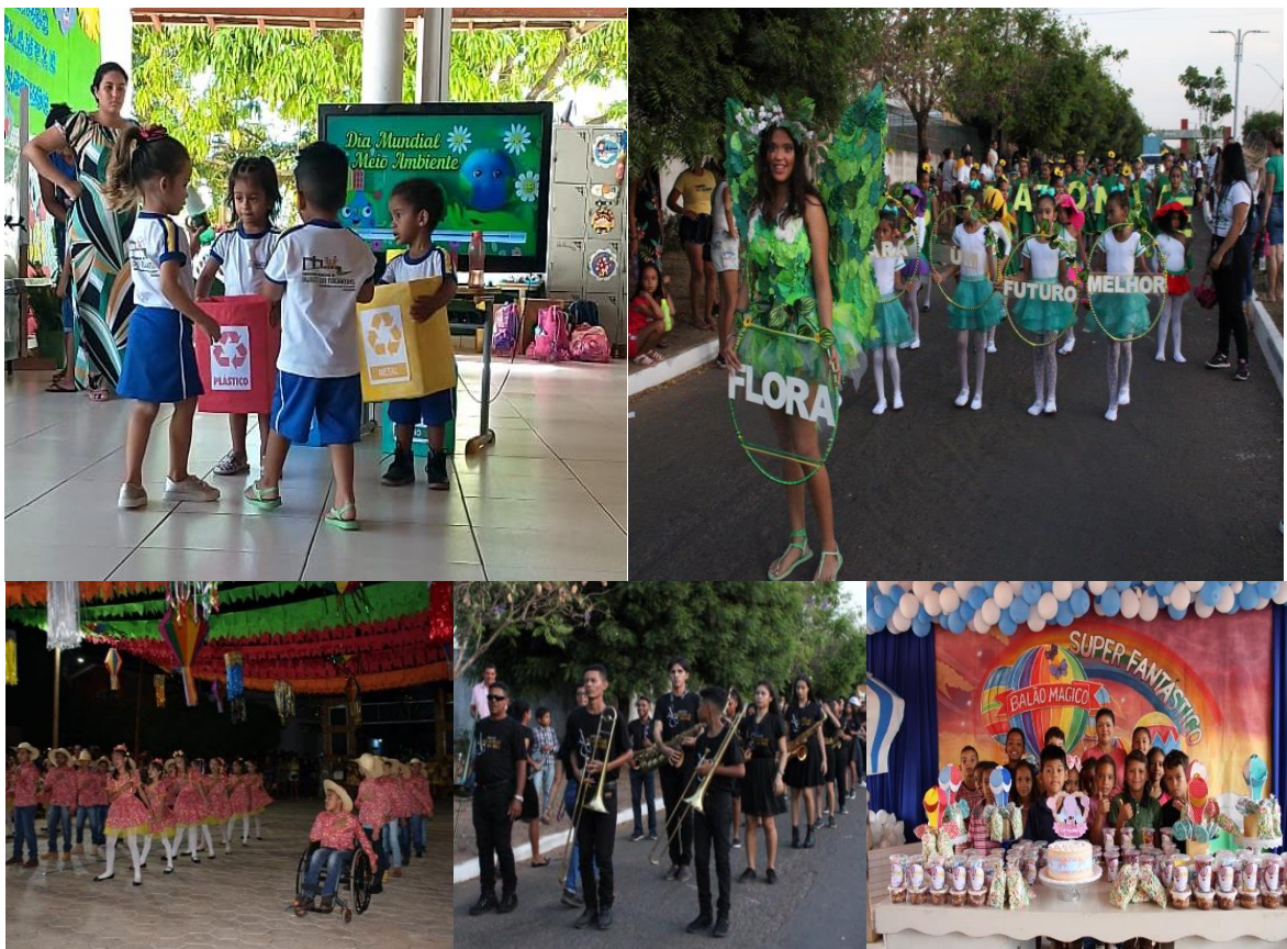
Alguns eventos: Dia do Meio Ambiente, 7 de Setembro, Festas Juninas, Dia das Crianças

Como diz a própria redação do PME esses momentos também servem para “incentivar a participação dos pais ou responsáveis no acompanhamento das atividades escolares dos filhos por meio do estreitamento das relações entre as escolas e as famílias”. (Estratégia 2.9 do PME).