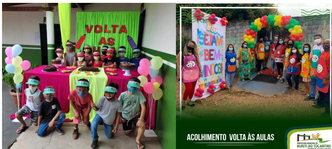
Acolhimento Volta às Aulas

Para validar a acolhida e garantir a disseminação de uma identidade escolar com mais equidade a gestão distribuiu uniforme escolar para as crianças da rede municipal de ensino. O Uniforme escolar é uma forma de padronização das crianças, caracterizando-os como responsabilidade municipal, facilitando a identificação dessa criança através do uniforme além do que a família demonstra claramente uma grande satisfação em receber.