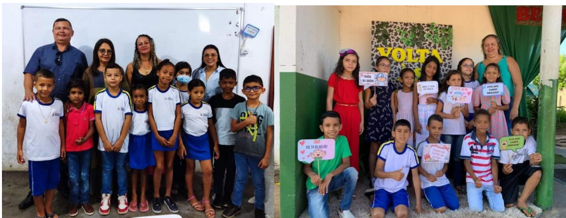
Entrega de Uniformes Escolares e Acolhimento Volta às Aulas

Para validar a acolhida e garantir a disseminação de uma identidade escolar com mais equidade a gestão distribuiu uniforme escolar para as crianças da rede municipal de ensino. O Uniforme escolar é uma forma de padronização das crianças, caracterizando-os como responsabilidade municipal, facilitando a identificação dessa criança através do uniforme além do que a família demonstra claramente uma grande satisfação em receber.