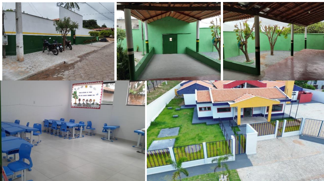
Reformas de Escola, Aquisição de Mobiliário, Nova Creche Tipo B