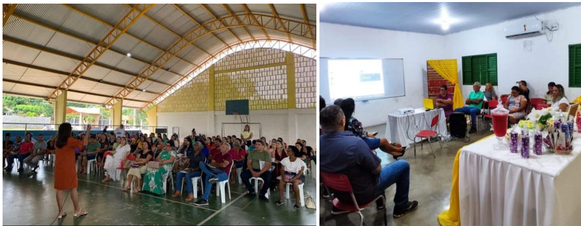
Formação Continuada Presencial e Via Meet

Em resumo, os momentos de formação continuada da equipe pedagógica desempenham um papel crucial na garantia de que a escola esteja sempre atualizada e que seus professores e demais servidores possam oferecer o melhor ensino possível aos alunos.