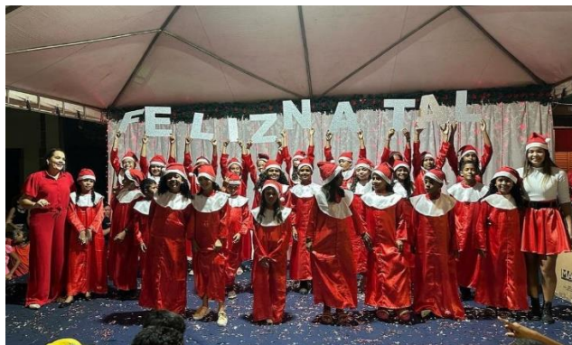
Apresentação de Alunos das Atividades Extracurriculares (música e coral)