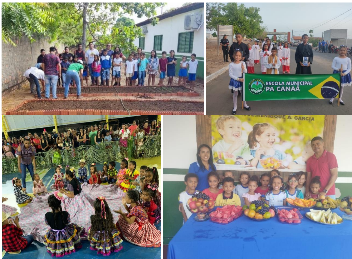
Alguns eventos: Dia do Meio Ambiente, 7 de Setembro, Festas Juninas, Semana da Alimentação

Como diz a própria redação do PME esses momentos também servem para “incentivar a participação dos pais ou responsáveis no acompanhamento das atividades escolares dos filhos por meio do estreitamento das relações entre as escolas e as famílias”. (Estratégia 2.9 do PME).