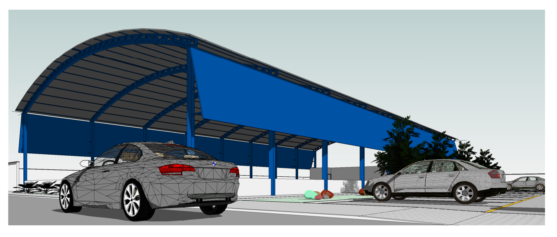
3 PERSPECTIVA 5